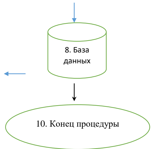
Схема 2. Обследование подкарантинной продукции, транспортных средств, складских помещений для проведения обеззараживания