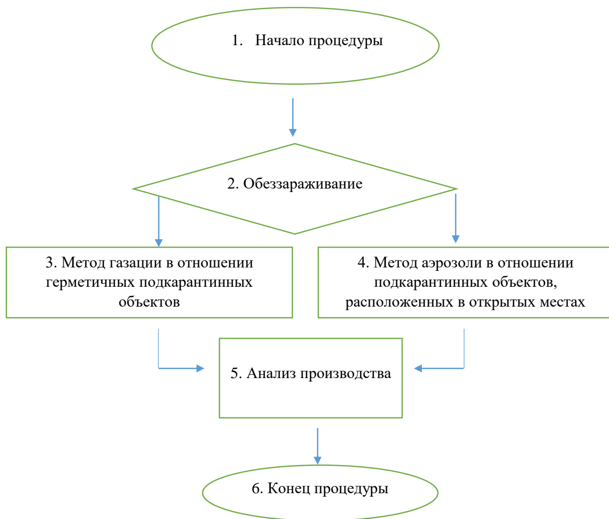
Схема 4. Выдача акта на выполненные работы по обеззараживанию, выдача акта карантинного фитосанитарного обеззараживания