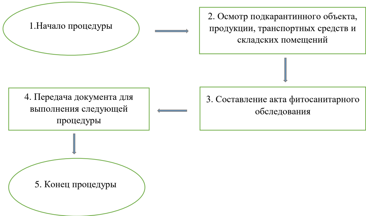
Схема 2. Проведение карантинного фитосанитарного обследования