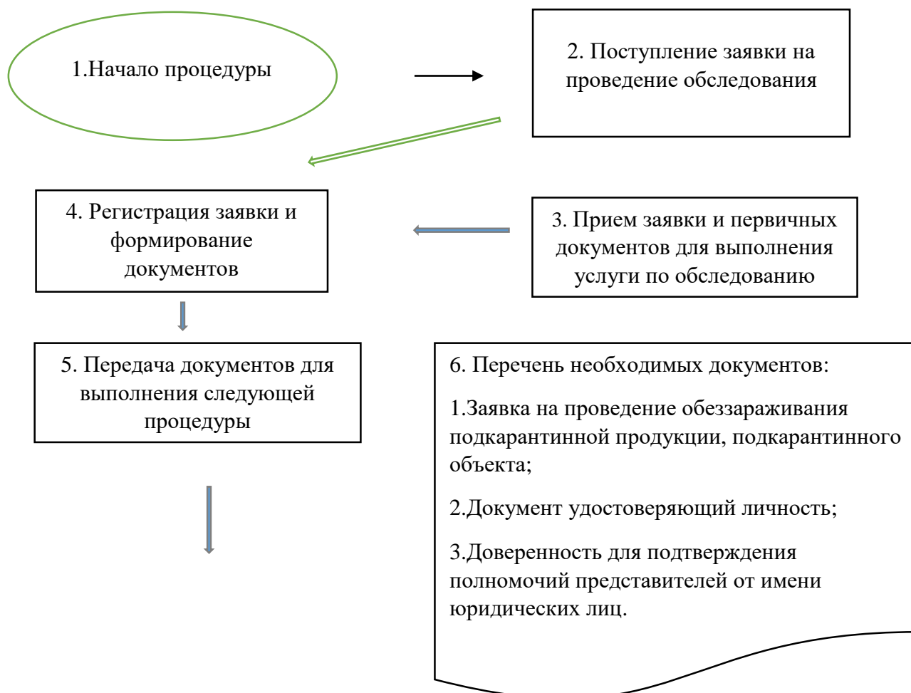
Схема 1. Прием заявки и предварительное рассмотрение документов на проведение обследования